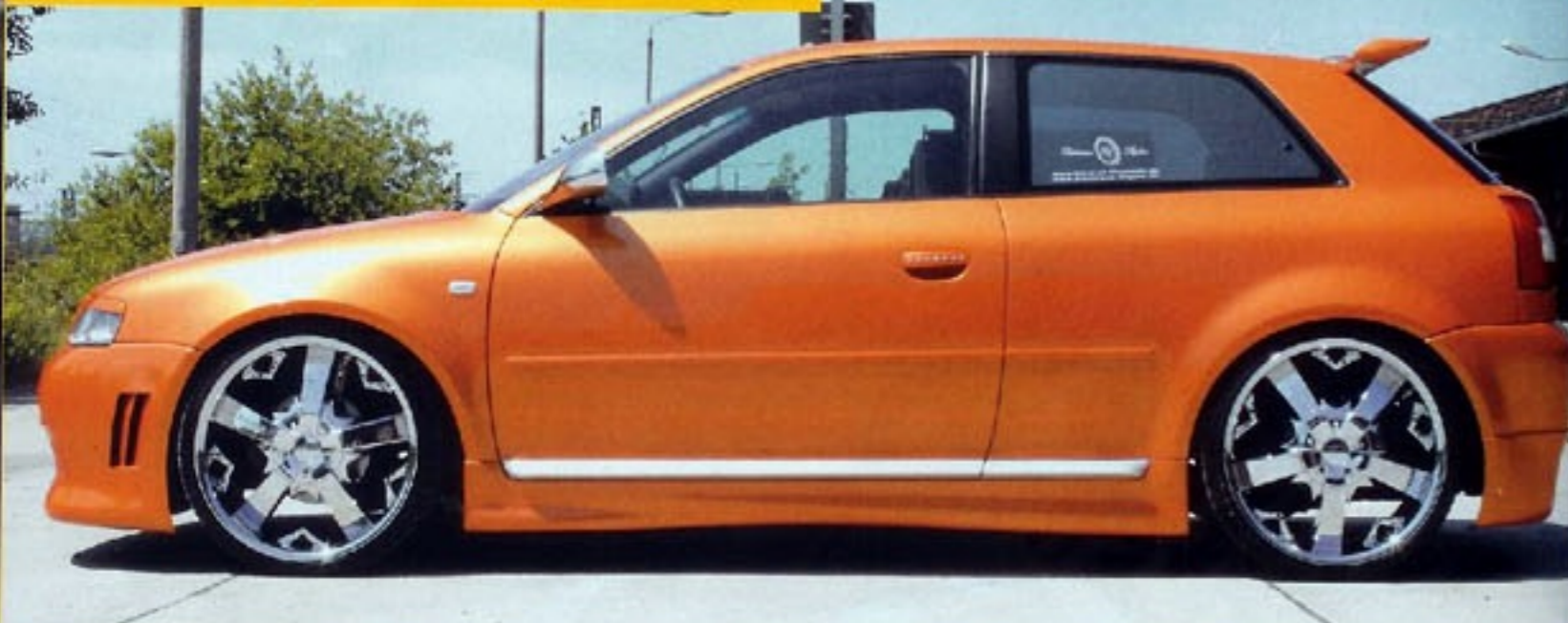
Die Flanken des in Orange gelackten A3 zieren polierte S3 Seitensplitter

Bauer noch Silberanteile in das Orange aus dem Hause Lamborghini, bevor sie die Karosserie damit einballe. Wenn der Wagen jetzt in der Sonne steht, funkelt das Lackkleid mit den Swarovski-Steinen, die das Schrauber-Team in die Nummernschildhalterung und die Griffe eingelassen hat, um die Werte. Diese erlesenen Kristalle finden sich auch an den riesigen 8 x 20 Zoll großen Velocity Wheels wieder. Doch auch ohne diese feinen Steine wird der Betrachter der chromglänzenden und mit 225/30er Gummis bezogenen Räder fast gezwungen eine Sonnenbrille aufzusetzen. Sie sitzen dank des High Sports-Gewinde-Fahrwerks von FK und entsprechender Distanzscheiben fett in den Radhäusern. Bei soviel Pomp von Außen kann man natürlich auch einiges vom Innenraum erwarten. Hat man erst mal die mit Brillanten besetzte Klinke betätigt und die Tür geöffnet, kann man es sich auf hochwertigen, mit Alcantara-Leder bezogenen Sitzen gemütlich machen. Schweift der Blick dann über die lackierten Armaturenbrettle samt Bose-Soundsystem und Alpine-Radio auf einen leeren Beifahrersitz, hilft bestimmt eine kleine Spritztour und Mann ist nicht mehr allein. Denn wir alle wissen: Diamonds are a girls best friend!