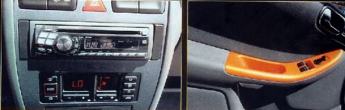
Alpine CD-Receiver mit MP3 Funktion

Bauer noch Silberanteile in das Orange aus dem Hause Lamborghini, bevor sie die Karosserie damit einballe. Wenn der Wagen jetzt in der Sonne steht, funkelt das Lackkleid mit den Swarovski-Steinen, die das Schrauber-Team in die Nummernschildhalterung und die Griffe eingelassen hat, um die Werte. Diese erlesenen Kristalle finden sich auch an den riesigen 8 x 20 Zoll großen Velocity Wheels wieder. Doch auch ohne diese feinen Steine wird der Betrachter der chromglänzenden und mit 225/30er Gummis bezogenen Räder fast gezwungen eine Sonnenbrille aufzusetzen. Sie sitzen dank des High Sports-Gewinde-Fahrwerks von FK und entsprechender Distanzscheiben fett in den Radhäusern. Bei soviel Pomp von Außen kann man natürlich auch einiges vom Innenraum erwarten. Hat man erst mal die mit Brillanten besetzte Klinke betätigt und die Tür geöffnet, kann man es sich auf hochwertigen, mit Alcantara-Leder bezogenen Sitzen gemütlich machen. Schweift der Blick dann über die lackierten Armaturenbrettle samt Bose-Soundsystem und Alpine-Radio auf einen leeren Beifahrersitz, hilft bestimmt eine kleine Spritztour und Mann ist nicht mehr allein. Denn wir alle wissen: Diamonds are a girls best friend!