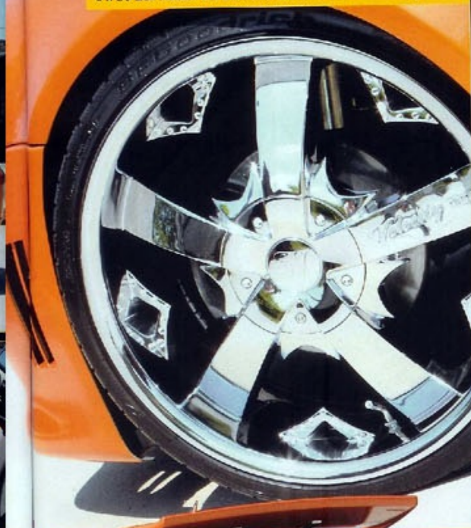
8 x 20 Zoll messen die Diamond Custom Räder von Velocity Wheels