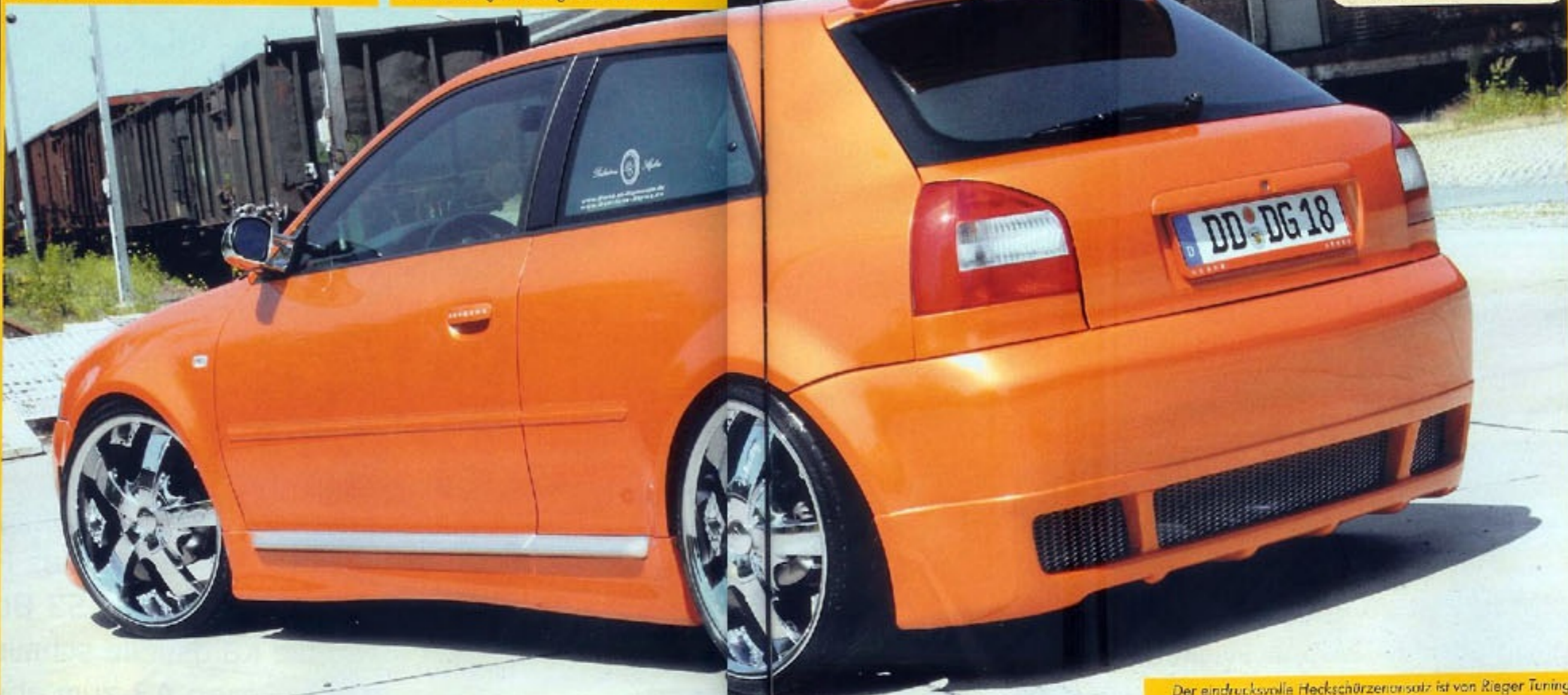
Der eindrucksvolle Heckschürzenersatz ist von Rieger Tuning