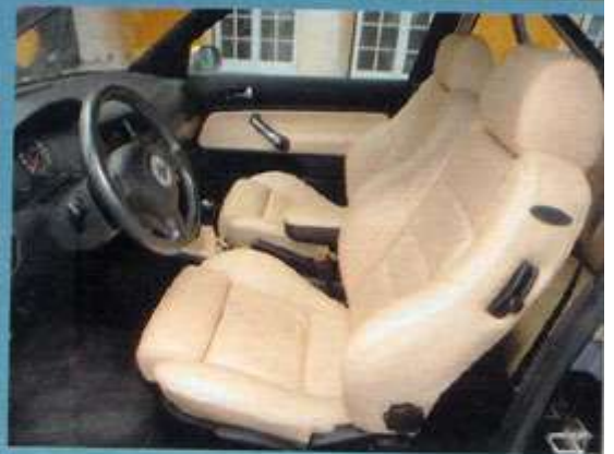
Die belgen Recaro-Stühle sind nicht nur sportlich, sie sehen auch gut aus