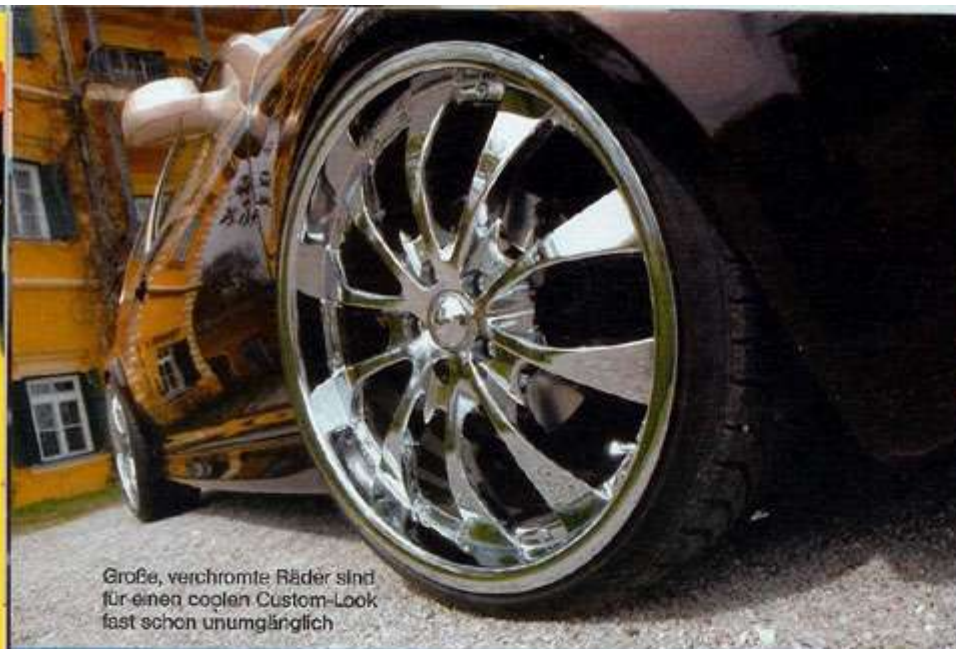
Große, verchromte Räder sind für einen coolen Custom-Look fast schon unumgänglich