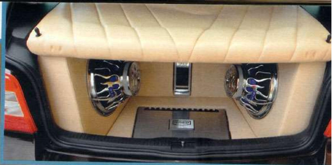
Der Kofferraum wurde zweckentfremdet und ist jetzt für jegliche Einkäufe zu schade